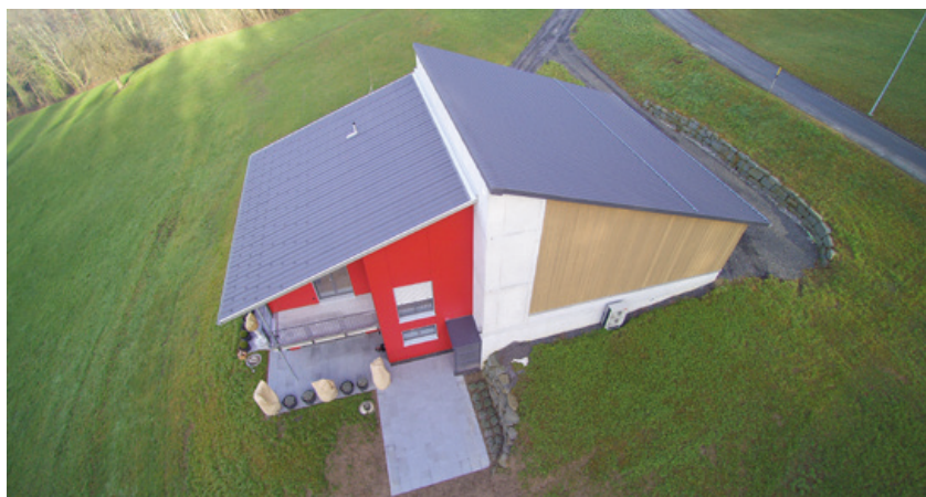
Hofstrasse 106 (Wanne)